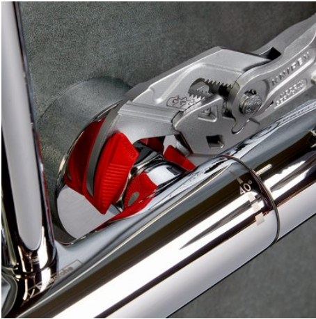
hurtigindstilling ved tryk på en knap